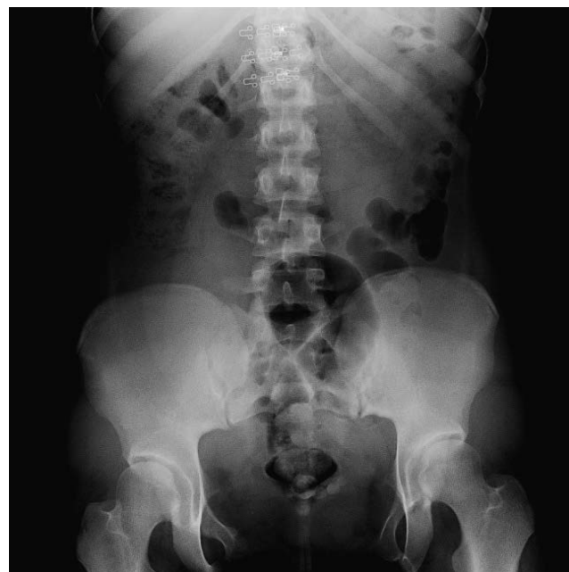
Рис. 3. Оглядова рентгенографія сечового міхура (2022 р.)

У квітні 2017 року пацієнтку госпіталізовано з діагнозом «Вроджена вада розвитку сечовидільної системи: екстрофія сечового міхура (стан після пластики); мікроцист; двобічний міхурово-сечовідний рефлюкс; стійке повне нетримання сечі; вторинний