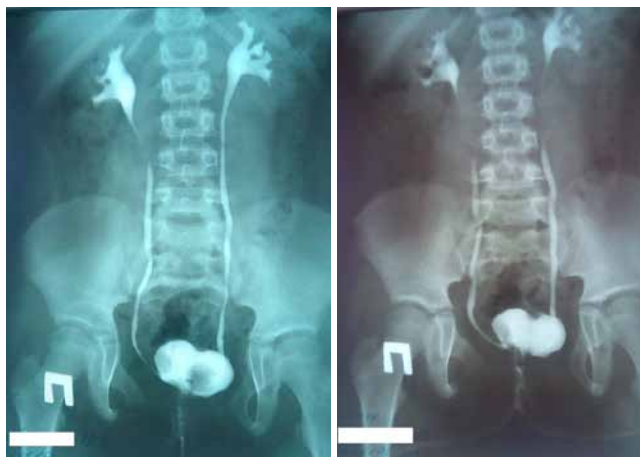
Рис. 1. Мікційна цистографія (2016 р.)

ного каменя збільшення цистопластик різними відділами кишечника швидко поширювалося і змінило тактику лікування дітей та дорослих пацієнтів із порушенням функції сечового міхура [12].