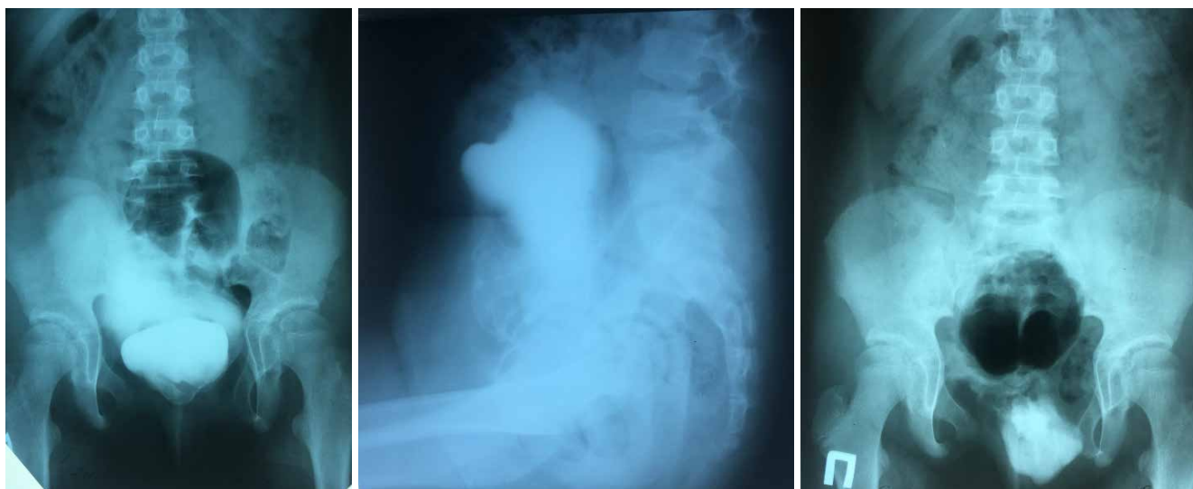
Рис. 2. Мікційна цистографія (2018 р.)

го сечового міхура. Найбільш перспективним, на нашу думку, є формування міхура за допомогою робот-асистованих технологій [2,4,10,11,23].