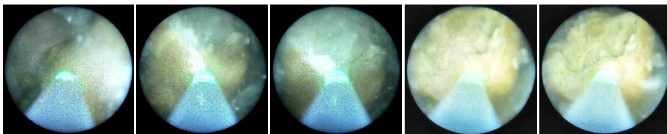
Рис. 6. Контактна лазерна літотрипсія конкрементів в аугментованому сечовому міхурі (2023 р.)

сечового міхура, відсутність міхурово-сечовідного рефлюксу на контрольній цистографії та наявність незначної кількості залишкової сечі після спорожнення сечового міхура (рис. 2). Клінічно пацієнтка суха, акт сечовипускання здійснюється за допомогою катетеризації. На ультразвуковому дослідженні (УЗД) сечового міхура 07.05.2018 року: форма нетипова; контур не рівний, не чіткий; розміри 80×60×115 мм; після сечопуску – 19×10×14 мм; вміст анехогенний, негомогенний, велика кількість завису. Медичний висновок: звертає увагу нетипова форма сечового міхура та велика кількість завису в сечовому міхурі.