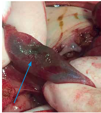
Рис. 2. IV стадія ВНЕК новонароджених після виконання анастомозу за Деніс–Брауном