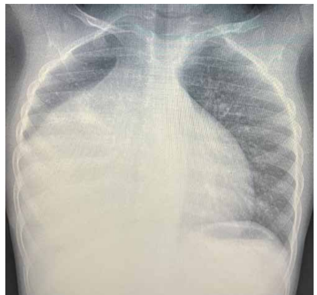
Рис. 3. Рентгенограма грудної клітки після 5 діб гормонотерапії

Виконано відкриту біопсію шляхом мініторакотомії по 5-му міжребер'ю. До рани прилягає новоутворення покрите капсулою. Видима частина пухлини представлена однорідною тканиною сіро-жовтого кольору, вкритою капсулою, м'яко-еластичної консистенції.