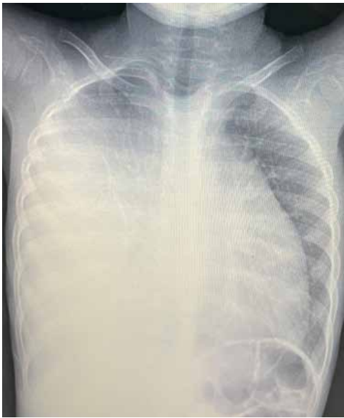
Рис. 1. Рентгенограма грудної клітки. Права легень субтотально затемнена. Тінь середостіння зміщена вліворуч із компресією лівої легень