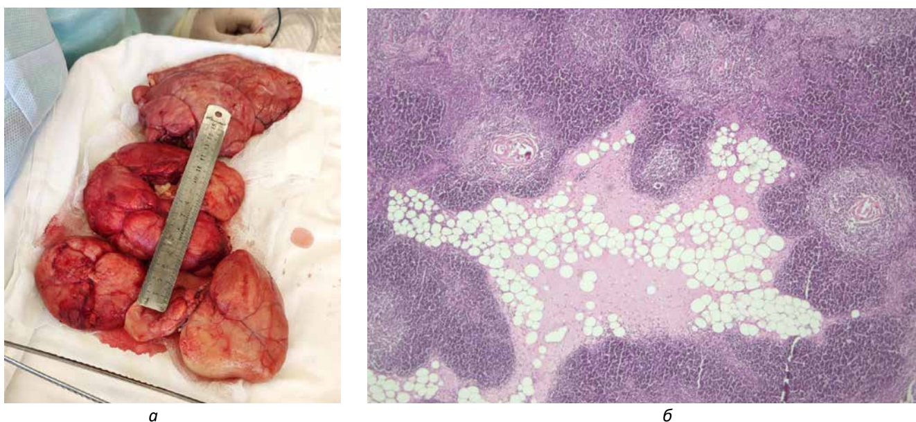
Рис. 5. а – макропрепарат; б – мікропрепарат (збільшення x50; фарбування гематоксином та еозином; фрагмент тканини тимуса з нечітким поділом на дольки, відзначається поділ на кортикальний та медулярний шари з наявністю тілець Гассалья, у тому числі кістозно розширених, серед тканин тимуса зі змінами, що можуть відповідати гіперплазії, відзначаються острівки жирової тканини

(стиснення легень, бронхів, зміщення середостіння), визначено хірургічну тактику радикального видалення новоутворення.