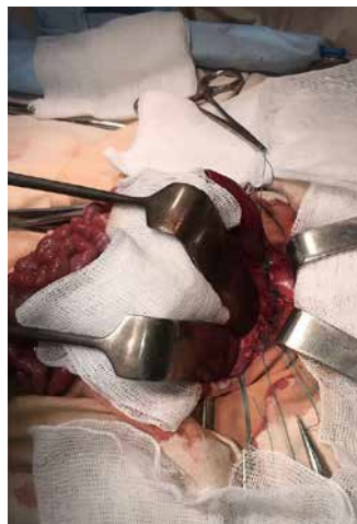
Рис. 5. Вигляд завершеної пластики діафрагми