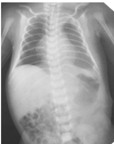
Рис. 7. Рентгенографія органів грудної клітки і черевної порожнини на сьому добу після операції