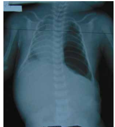
Рис. 6. Оглядова рентгенографія органів грудної клітки і черевної порожнини на другу добу після операції