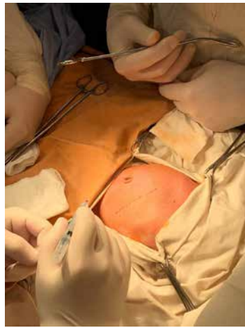
Рис. 2. Розмітка лівобічної субкостальної лапаротомії зі збільшеним відступом від реберної дуги