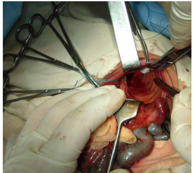
Рис. 3. Аплазія лівого купола діафрагми