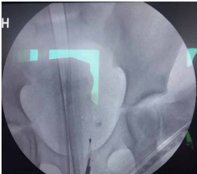
Рис. 2. Екстракція конкременту із сечоводу корзиною Dormia

понад 8 мм та в нижній третині сечоводу – 5–7 мм, а щільність конкрементів – від 750 HU (Hounsfield Units) і вище.