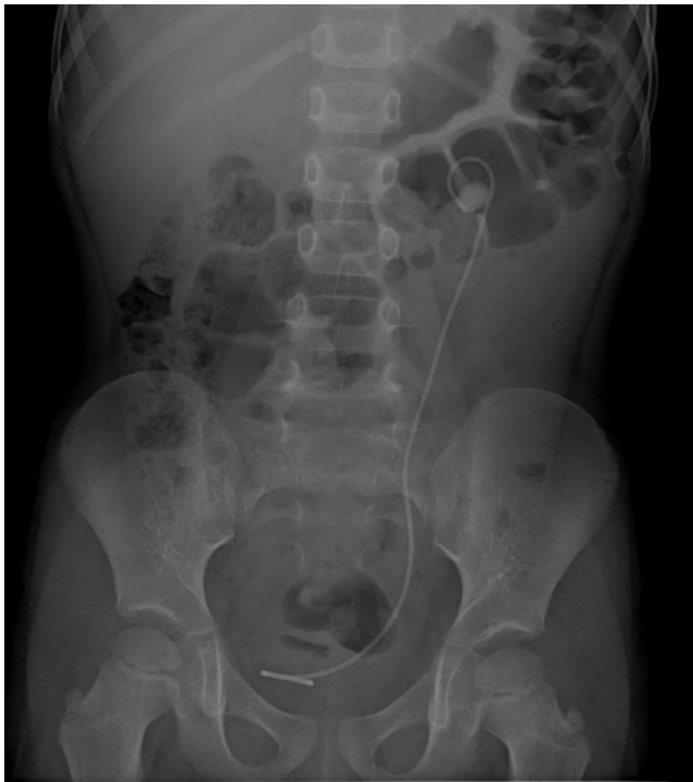
Рис. 1. JJ-стент у сечових шляхах хворого з конкрементами в нижньому цистоді сечоводу та порожнистій системі нирки зліва