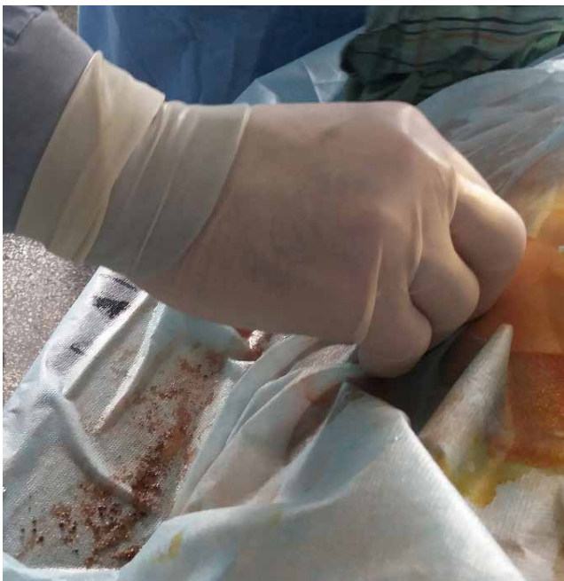
Рис. 7. Відмивання дрібних фрагментів конкременту через амплац під час мінічерезшкірної нефролітотрипсії