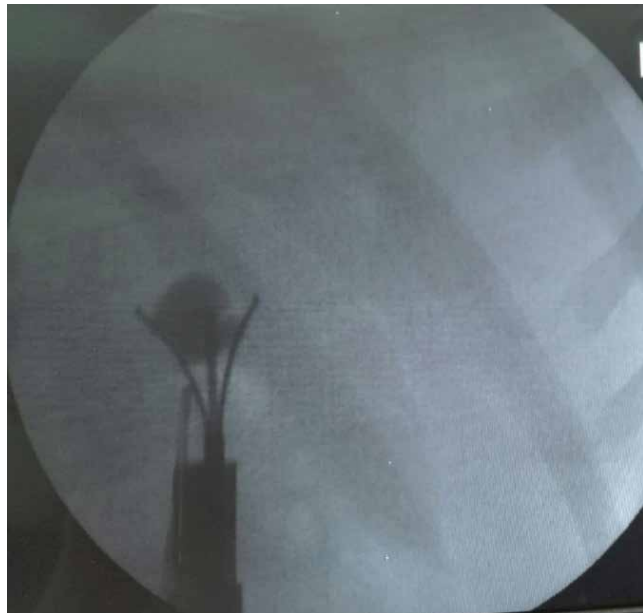
Рис. 6. Видалення фрагментів конкременту з порожньої системи нирки під поліпозиційним рентгеноскопічним контролем

За результатами рентгенструктурного аналізу конкрементів діагностували оксалати – кальцієві солі щавлевої кислоти, для яких характерна значна щільність і шорстка поверхня з гострими гранями. Відповідно до хімічного складу конкрементів пацієнтам надали рекомендації стосовно питтєвого режиму, харчування та медикаментозної метафілактики сечокам'яної хвороби.