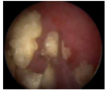
Рис. 5. Видалення фрагментів конкременту з порожньої системи нирки під оптичним контролем