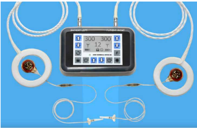
Рис. 1. Стимулятор діафрагмального нерва Diaphragm Pacemaker (Avery Biomedical Devices, Inc. США)