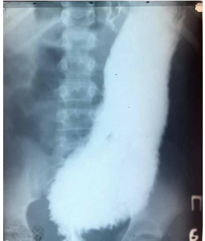
Рис. 3. Ригмограма дитини К., віком 7 років, оперований з приводу аноректальної мальформації (ректоуретральної нориці). Патологічне розширення прямої і сигмоподібної кишки за відсутності стенозу неоануса

Загальна частота ускладнень за матеріалами великих спеціалізованих стаціонарів, які мають великий досвід лікування дітей з АРМ, становить від 22,7% до 40,4% [14,22,24]. Усі хворі, прооперовані з приводу АРМ у клініці дитячої хірургії Івано-Франківського національного медичного університету, одужали після хірургічного лікування. Ранні