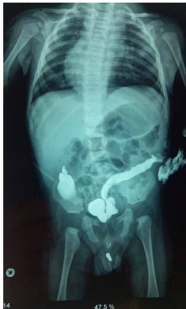
Рис. 2. Дистальна колостографія в дитини М. (вік 4 місяці) із високою аноректальною агенезією. Контраст потрапив через норицю в сечовий міхур, а звідти – у ниркову миску праворуч (вказано стрілками). Дослідження дало змогу діагностувати не тільки ректовезикальну норицю, але й інфравезикальну обструкцію і міхурово-сечовідний рефлюкс праворуч

У 19 (51,35%) хворих виявили низькі (інфралевавторні) форми АРМ, у 8 (21,62%) дітей – високі (супралевавторні) форми, у 10 (27,03%) пацієнтів – проміжні (інтралевавторні) форми АРМ. Найчастішим варіантом вад у дівчаток була ректовестибулярна