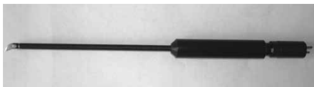
Рис. 2. Біполярний скальпель (фото)

водиться в задану ділянку і, при включеному струмі, лезо переміщується по рановій поверхні перпендикулярно до площини його розташування. На рис. 2 наведено фотозображення запропонованого електроскальпеля.