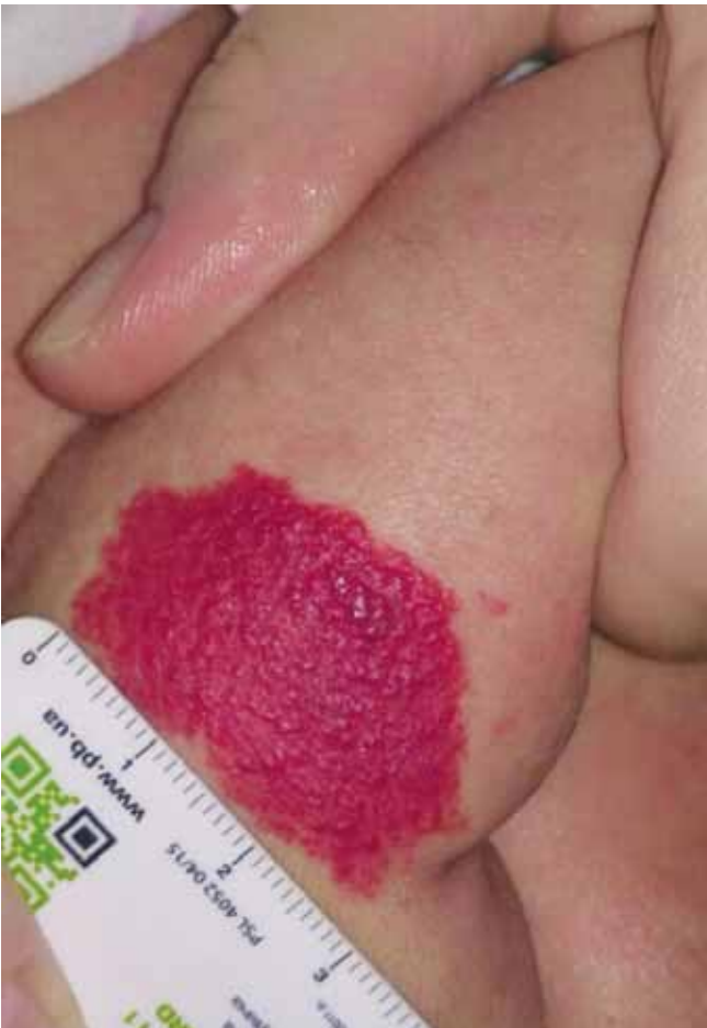
Рис. 3. Вигляд гемангіоми до початку лікування