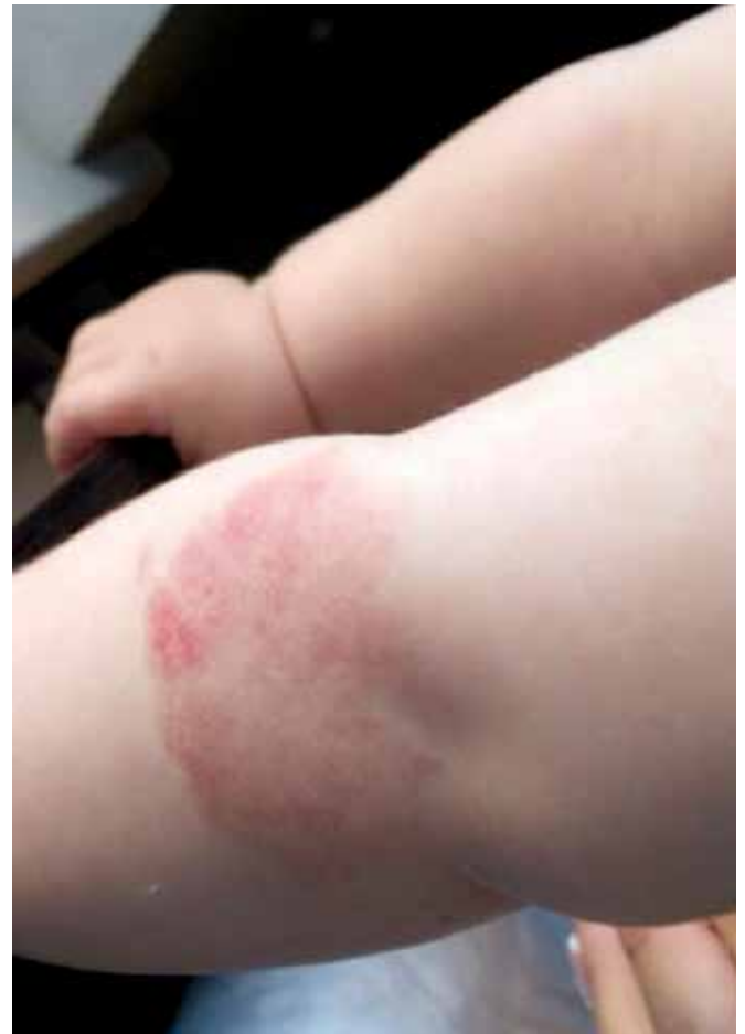
Рис.4. Регресія гемангіоми через чотири місяці від початку лікування