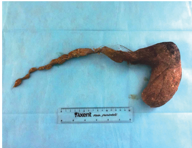
Рис.2. Трихобезоар желудка

Рентгенография органов брюшной полости: свободного газа в брюшной полости нет. Кишечные арки, горизонтальные уровни жидкости не определяются. В проекции селезеночного угла определяется дополнительная тень бобовидной формы