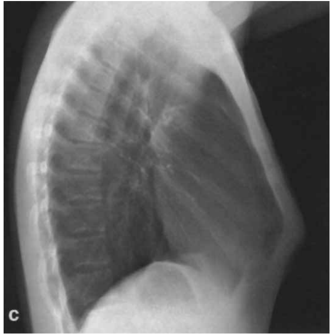
Рис. 1. Рентгенограма грудної клітки у правій боковій проекції з позначеними відстанями вимірювання

Застосування акушерського циркуля з метою визначення передньо-задніх розмірів грудної клітки при КДГК не дає достовірних результатів через відсутність відповідних анатомічних орієнтирів, від яких потрібно відштовхуватись при різних типах та формах деформації.