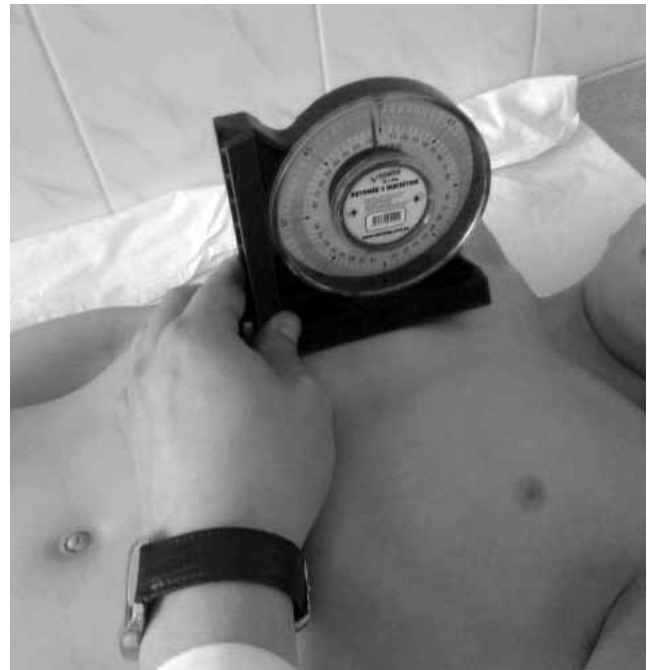
Рис. 3. Визначення кута відхилення груднини та пригруднинних ділянок у здорової дитини

Серед дітей з ВКДГК, нами відібрано 92 пацієнти різного віку з II та III ступенем деформації, яким по-