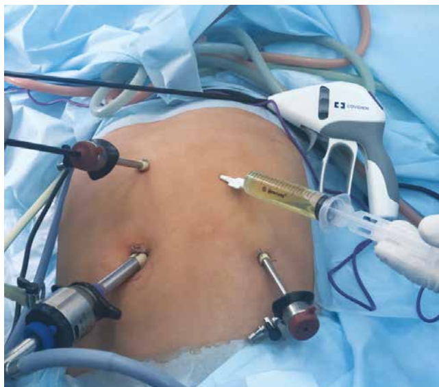
Рис. 1. Розташування портів при лапароскопічній корекції кісти селезінки

тривалий безсимптомний перебіг захворювання. Перші клінічні ознаки цієї патології з'являлися лише тоді, коли кісти досягали великих розмірів, або під час планового ультразвукового дослідження.