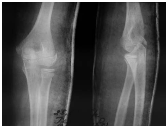
Рис. 2. Перелом шийки променевої кістки у дитини після репозиції за методикою Н.П. Свінухова