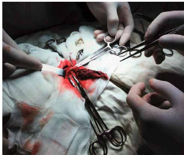
Рис. 4. Хворий Т., вік 7 р., МКСХ №94/24. Інтраопераційне фото: загальний вигляд перекрученого пасма великого чепця

На момент госпіталізації загальний стан дитини середнього ступеня важкості. Рс 90 на 1 хв., температура тіла 37,0°C. Загальний аналіз крові та сечі на момент госпіталізації без патологічних змін. При огляді живіт симетричний, передня черевна стінка бере участь в акті дихання, однак при пальпації дитина напружує прямі м'язи живота. При глибокій пальпації визначається різка болючість по правому фланку живота. Симптоми подразнення очеревини слабо позитивні в правій здухвинній ділянці. При