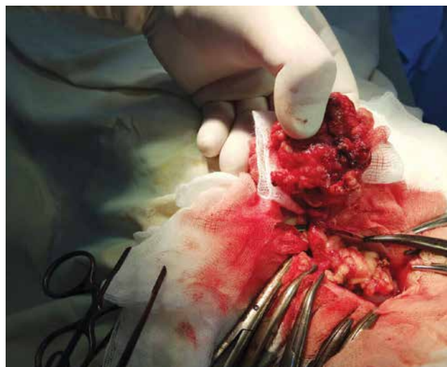
Рис. 2. Хворий П., вік 17 р., МКСХ №4448. Інтраопераційне фото: загальний вигляд перекрученого пасма великого чепця